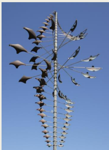
Whirligig - Lyman Whitaker