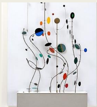
Kinetic Object - Abraham Palatnik